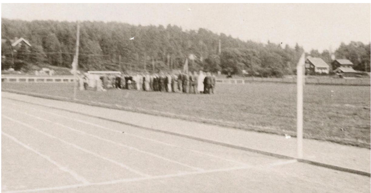
Invigningen av Kullaborgs idrottsplats 12 september 1943.

”Tack vare att medlemmarna utförde otaliga timmar av frivilligt arbete och att ortsborna välvilligt skänkte gåvor i form av grus, lera, gödsel, tegel med mera kunde kostnaden för idrottsplatsen hållas nere till 24 000 kronor.” berättade Harry Johansson.